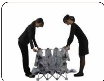
② 本体をゆっくりと広げて下さい