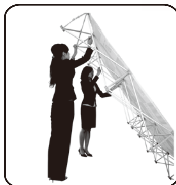
④ 上部は本体を傾けながら、全てのストッパーを固定して下さい