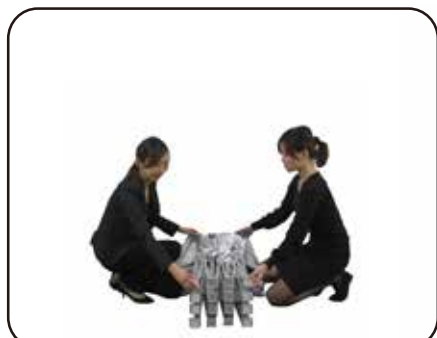
① 収納バッグから取り出して下さい