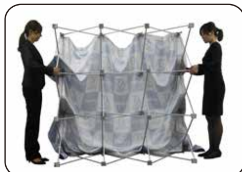
③ 絶対に無理に力を加えないで下さい